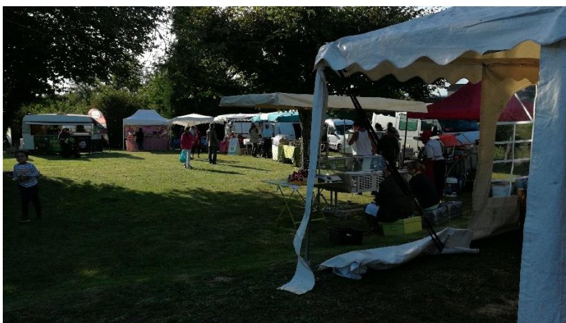
Les chapiteaux sous le soleil